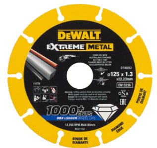
DEWALT EXTREME® METAL, LE DISQUE DIAMANT LE PLUS RÉSISTANT Conception innovante pour des découpes performantes